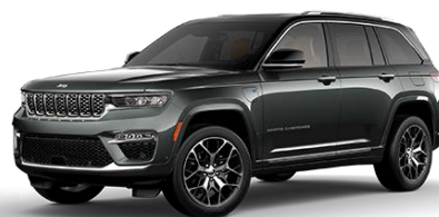
sivá Baltic 602 | OPY 1 500 €