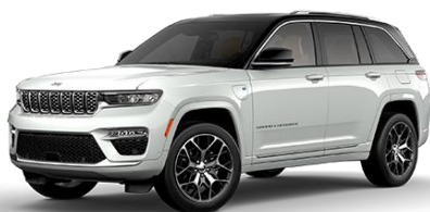
biela Bright 207 | OUU 1 500 €