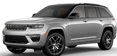
strieborná Zynith 605 | OSE 1 500 €