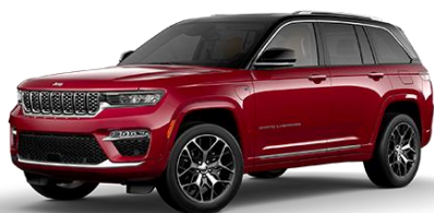
červená Velvet 124 | OSD 0 €