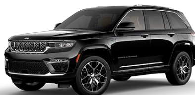
čierna Diamond PXJ | 61Q 1 500 €