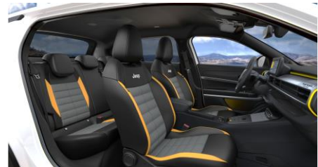
Obrázky sú ilustračné