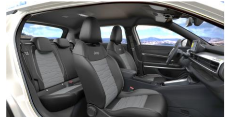
Obrázky sú ilustračné