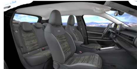
Obrázky sú ilustračné