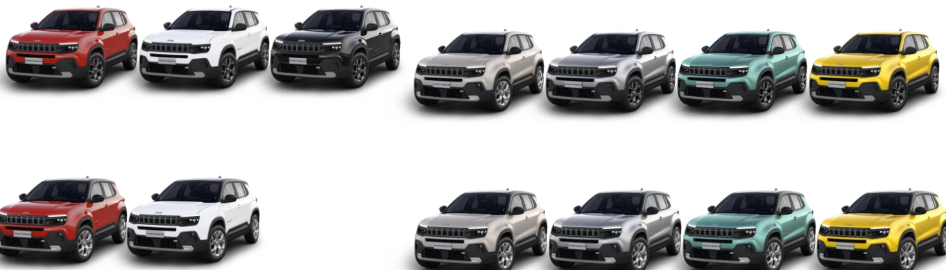
Obrázky sú ilustračné