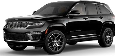
čierna Diamond PXJ | 61Q 1 500 €