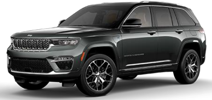
sivá Baltic 602 | OPY 1 500 €