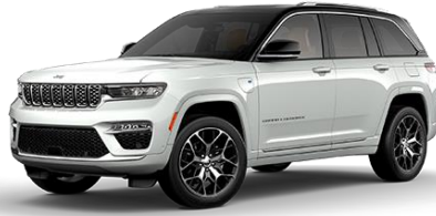
biela Bright 207 | OUU 1 500 €