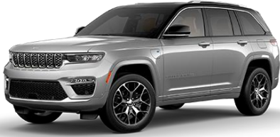
strieborná Zynith 605 | OSE 1 500 €