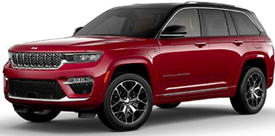
červená Velvet 124 | OSD 0 €