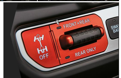
Obrázky sú ilustračné