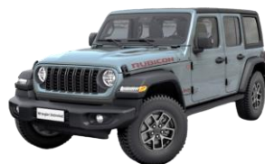
sivá Anvil 1 150 €