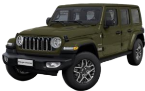
zelená Sarge 0 €