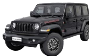
sivá Granite crystal 1 150 €