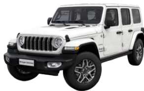
biela Bright 1 150 €