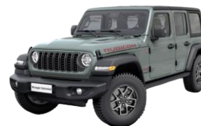
sivá Earl 1 150 €