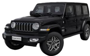
čierna 1 150 €