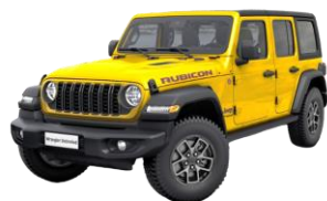
žltá High Velocity 1 150 €