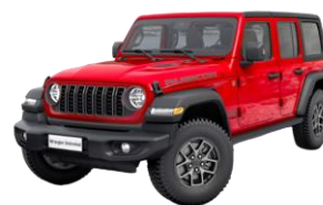
červená Firecracker 1 150 €