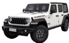
biela Bright 1 150 €