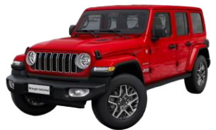
červená Firecracker 1 150 €