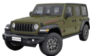
zelená Sarge 0 €