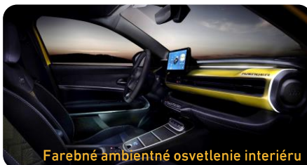
Farebné ambientné osvetlenie interiéru