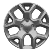
17" disky z ľahkých zliatin matná strieborná Paket TECH & STYLE