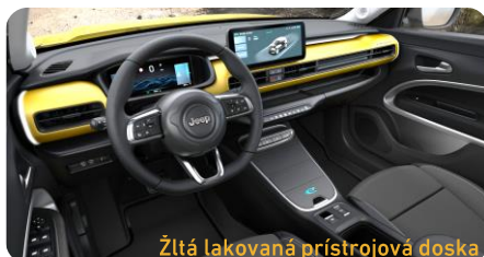
Žltá lakovaná prístrojová doska