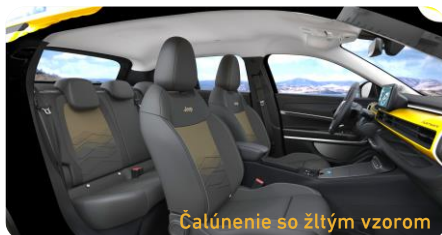
Čalúnenie so žltým vzorom