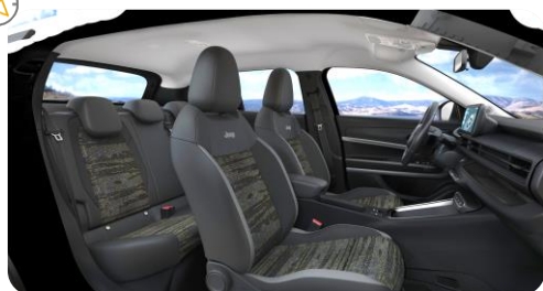
Obrázky sú ilustračné