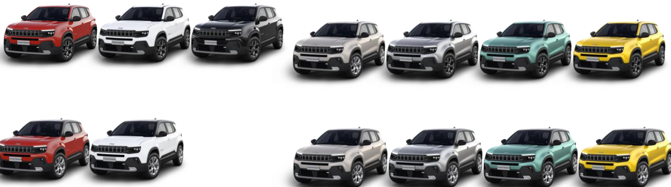
Obrázky sú ilustračné

Žltá lakovaná prístrojová doska a čalúnenie sedadiel látka/vinyl so žltým vzorom